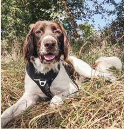
Nivard, de Drentse Patrijshond van de kluis van Prébenoit.

woont, en mensen van ver en dichtbij komen hem bezoeken, hetzij uit nieuwsgierigheid, hetzij om een gebed bij te wonen in zijn kapel, of voor een goed gesprek... Ja, over hem wil de een of andere krant of tijdschrift wel eens een artikel schrijven – je hoort mij overigens niet zeggen dat dat niet interessant zou zijn, hoor – maar hij is toch niet de enige hier?