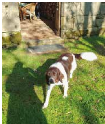
Nivard, een jachthond die de deugd van de omzichtigheid en de discretio beheerst.