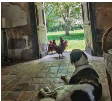
Nivard en 'zijn' kippen aan de achterdeur van de kluis.