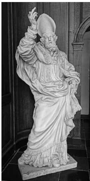
Sint-Eucherius, witgeschilderd houten beeld in de abtvsleugel.