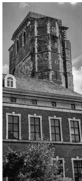
Zicht op de abdijsleugel vanuit de abtsleugel.

Na de Belgische onafhankelijkheid bleef de provincie Limburg onder de bisschop van Luik. Het Klein Seminarie van het bisdom werd in 1843 in de oude abdij ondergebracht. De Gentse architect Louis Roelandt had al tussen 1839 en 1843 enkele nieuwe bijgebouwen ontworpen zodat er nu ook een normaalschool kon functioneren. De nieuwe toren voor de Onze-Lieve-Vrouwekerk kwam er als een extraatje bij. Op de plaats van de oude abdiijkerk verrees zowaar een nieuwe seminariekerk. Daarmee werd terug aangesloten bij het verleden, want in 1589 had de seculiere Luikse prinsbisschop Ernest van Beieren (1554-1612) in Sint-Truiden al een Klein Seminarie opgericht.