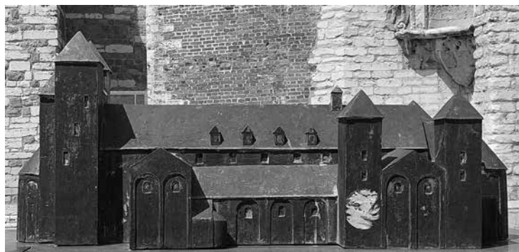
Toegang tot de abdijsite (zicht vanuit Grote Markt) met de maquette van de abdijkerk.

nieuwde groei van de abdij nam ook de bewoning rondom gestaag toe. Onder het abbatiaat van Adelardus II gingen vanaf 1055 grootse bouwwerken van start: een nieuwe abdijkerk, opgetrokken volgens het Ottoonse plan, was er het mooie resultaat van. 6 De keizersloge van die kerk is nog altijd aanwijsbaar in de kerktoeren. In de 12de eeuw diende de abdijkerk geregeld hersteld te worden, maar het kostenplaatje vormde geen probleem: de toeloop van pelgrims en een groeiende stedelijke bevolking maakten dat er genoeg geld binnen kwam. Naast het abdiydomein floreerden de lakennijverheid en haar jaarmarkt in de slagschaduw van Maastricht. 7