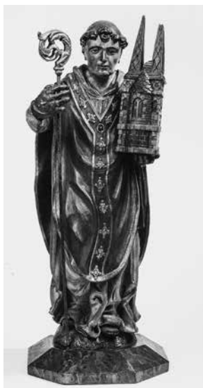
Beeld van Sint-Trudo, 17de eeuw, collectie De Mindere (Museum Franciscanen Sint-Truiden).