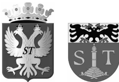
(Oudere) wapenschilden van Sint-Truiden (1819 en 1878), met dubbelkoppige adelaar en perroen.

hun vrije tijd konden vermeien in het iets bescheidener Speelhof. Aan het einde van de 18de eeuw kwam aan deze situatie een abrupt einde. In augustus 1789 volgde Sint-Truiden de stad Luik in de Luikse Revolutie. Op 25 mei 1790 bestormden Truienaars de abdij en stichtten er brand. Vier monniken zochten hun toevlucht in de stad, de anderen werden in de abdij van Vlierbeek opgevangen. Daar werd Eucher Knaepen op 1 september 1790 tot abt benoemd. In 1791 kregen de Truienaars vergiffenis voor hun opstand. 10 De normalisatie was echter van korte duur, want de inval van Franse revolutionaire troepen betekende het einde van de abdij. Abt en monniken vluchtten in 1794 naar Duisburg en de abdijsgoederen werden aangeslagen. De zeventien klokken en de abdijsbibliotheek versasten naar Maastricht, de hoofdplaats van het departement Nedermaas waaronder het kanton Sint-Truiden toen ressorteerde.