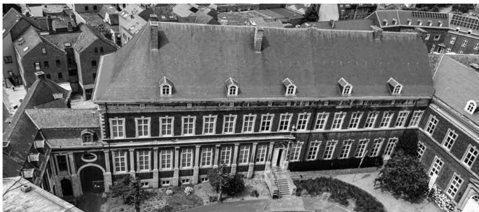
Zicht op de abtsvleugel vanuit de abdiijtoren.

De kerktoeren en de abdiijresten zijn sinds 1935 beschermd als monument. In 1986 werd de bescherming uitgebreid tot de hele site en sinds 22 september