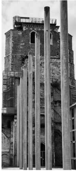
De zuilenrij: markering van de pilaren van de oude abdijkerk.

gewoon naar boven. Maar boven op de toren loont het de moeite eventjes naar beneden te kijken. Vanop die plek zie je immers de contouren van de romaanse abdijkerk die in 1999 op het kerkveld zichtbaar werden gemaakt: acht zuilen (symbool voor de eeuwigheid) markeren de plaats en de hoogte (18 m) van de pilaren in het zuidelijk kerkship.