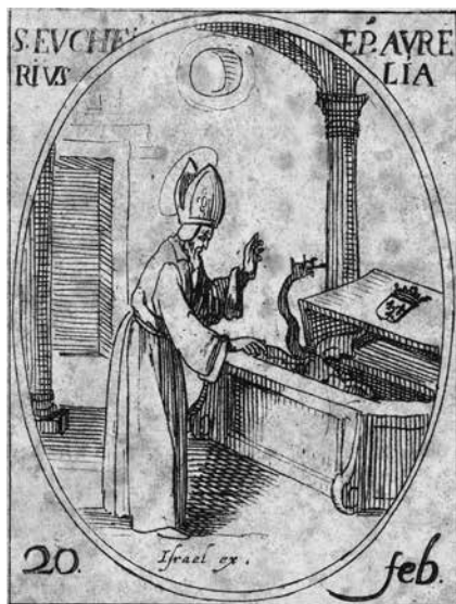
Israël Henriët, Sint-Eucherius drijft de duivel uit het graf van Karel Martel , gravure gepubliceerd in: Jacques Callot, Les Images De Tous Les Saints et Saintes de L'Année , Parijs, 1636.

De stichter werd omstreeks 693 in zijn kerkje begraven. Die plek werd een pelgrimsoord nadat er enkele wonderen waren gebeurd. Automatisch volgde de heiligverklaring van Trudo – op een munt van Karel de Grote uit 780 prijkte zelfs de beeltenis van Sci Trudo , de heilige Trudo – en nabij het klooster werd in accommodatie voor de pelgrims voorzien. Het Sancti Trudonis Oppidum slokte gaandeweg het nabijgelegen Zerkingen op. Als stadsdeel werd het de Sint-Pietersparochie met een kerk die omstreeks 1180-1190 in opdracht van de abdij werd gebouwd. De abt benoemde er tot het einde van het Ancien Régime de pastoor. 4