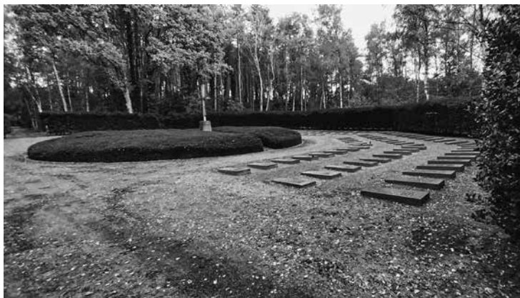
De begraafplaats van de Mariazusters van Franciscus en hun rectors.