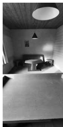
Pandgang in de Roosenbergabdij en zicht op het spreekhoekje in het kantoor van de overste.