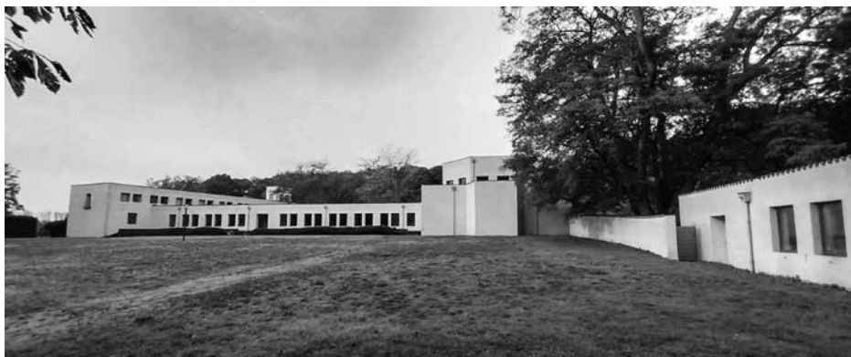
Tuinzicht op de abdijstructuur van Roosenberg.

dit door het bisdom goedgekeurde project gerealiseerd geweest zijn, dan zou dat een zware hypotheek hebben gelegd op het ontwerp van dom Van der Laan. De zuiverheid van ontwerp is hier immers een van de sterkhouders. Een volume toevoegen is geen goed idee, omdat daardoor de typische cijfersymboliek van Van der Laan de mist zou ingaan.