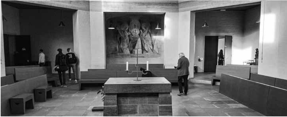
De abdijkerk (zicht op het altaar).

rood voor tafels en gelige kleur voor stoelen en kasten – cf. brief 6) kan een deel van de authentieke lichtbeleving herstellen, terwijl met een aantal noodzakelijke verduurzamingswerken de bedrijfsvoering alleen nog maar verbeterd kan worden. De in 2009 opgerichte vzw Vrienden van de Roosenbergabdij kan er spirituele en culturele activiteiten blijven organiseren. De abdijkerk blijft immers ook open als oecumenische reflectieruimte: een plaats van samenkomst, een schrijn, een sanctuarium, een getuige van de deus absconditus (de verborgen God) en een amplificatie van de universele notie dat het hier om een ‘gekregen plaats’ gaat. 8