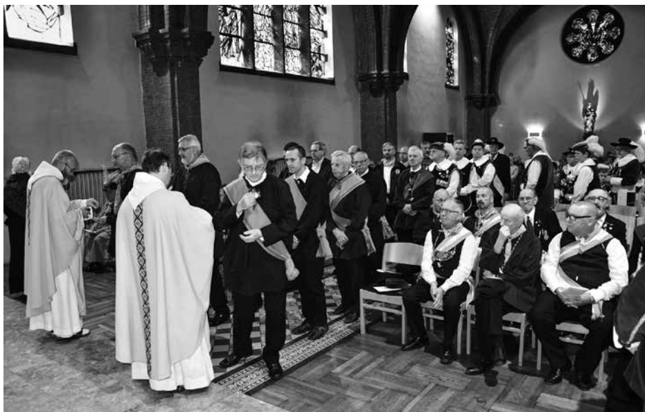
Communieuitreiking tijdens de jubileumviering van de Hoge Gildeeraad van Brabant in abdij Keizersberg, 2014.

moeten voortdurend worden bijgevuld. Het zijn de hersenen – het hoofd – die het water verdelen over de verschillende cellen, al naar gelang hun behoeften. Het is het Hoofd van het Mystieke Lichaam van Christus, Christus zelf, die zich geeft aan hen die Hem het meest nodig hebben. Dat is wat Hijzelf ook zegt in het evangelie.