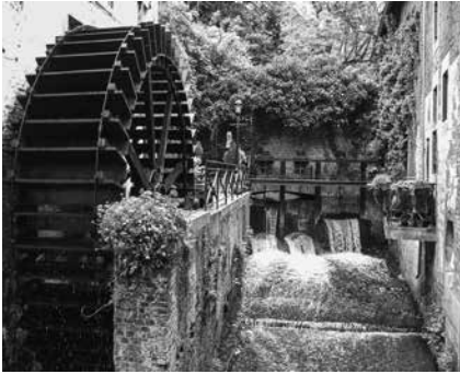
Watterrad in het oude stadscentrum van Maastricht.