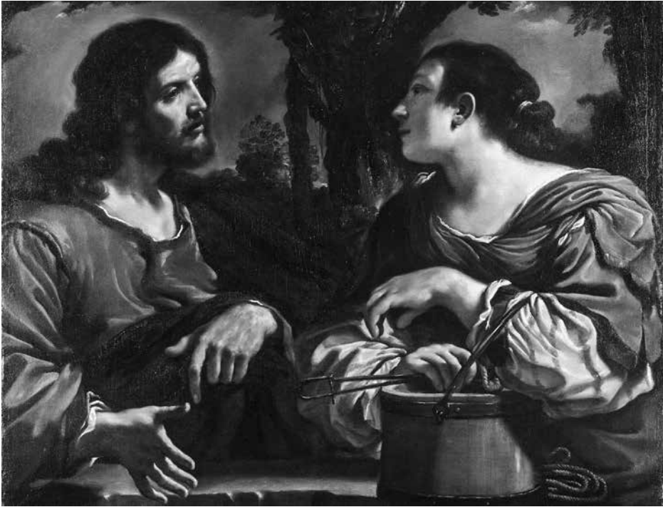
Il Guercino (Giovanni Francesco Barbieri), Jesus en de Samaritaanse vrouw , olie op doek, ca. 1620, Kimbell Art Museum, Fort Worth (Texas). Jezus maakt zich aan de Samaritaanse vrouw bekend als het Levend Water.

dag van de Sukkotvieringen verduidelijkt Jezus echter: “Laat wie dorst heeft bij mij komen en drinken! ‘Rivieren van levend water zullen stromen uit het hart van wie in Mij gelooft’, zo zegt de Schrift.” (Joh 7,37b-38) Opnieuw vertelt Hij de mensen dat zij die in Hem geloven en hun dorst lessen met het levende water dat Hij is, kunnen verwachten door en met Hem vervuld te worden. Ten slotte spreekt ‘Hij die op de troon zat’ – de Albeheerser uit het boek Openbaring –, zodra de nieuwe hemel en de nieuwe aarde zijn gemaakt: “Het is voltrokken. Ik ben de alfa en de omega, het begin en het einde. Wie dorst heeft geef Ik vrij te drinken uit de bron met water dat leven geeft.” (Apok 21,6) In dit geval zegt Hij het onomwonden: Hij geeft zichzelf, het levende water, aan de dorstigen, zonder moeite of kosten.