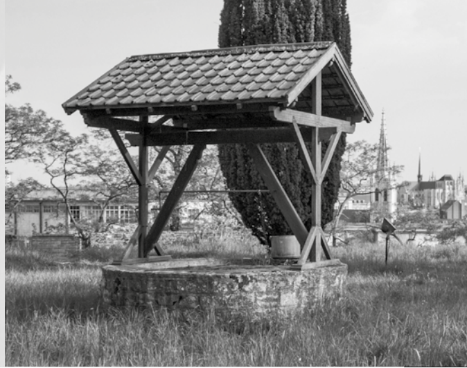
Waterput van de hertogelijke burcht op de abdij-site van Keizersberg in Leuven.

de liturgie. God is zeer reëel en tastbaar aanwezig in de liturgie, net zoals water uit een bron echt, tastbaar en drinkbaar is. We kunnen die analogie uitbreiden en nog andere elementen aanstippen.