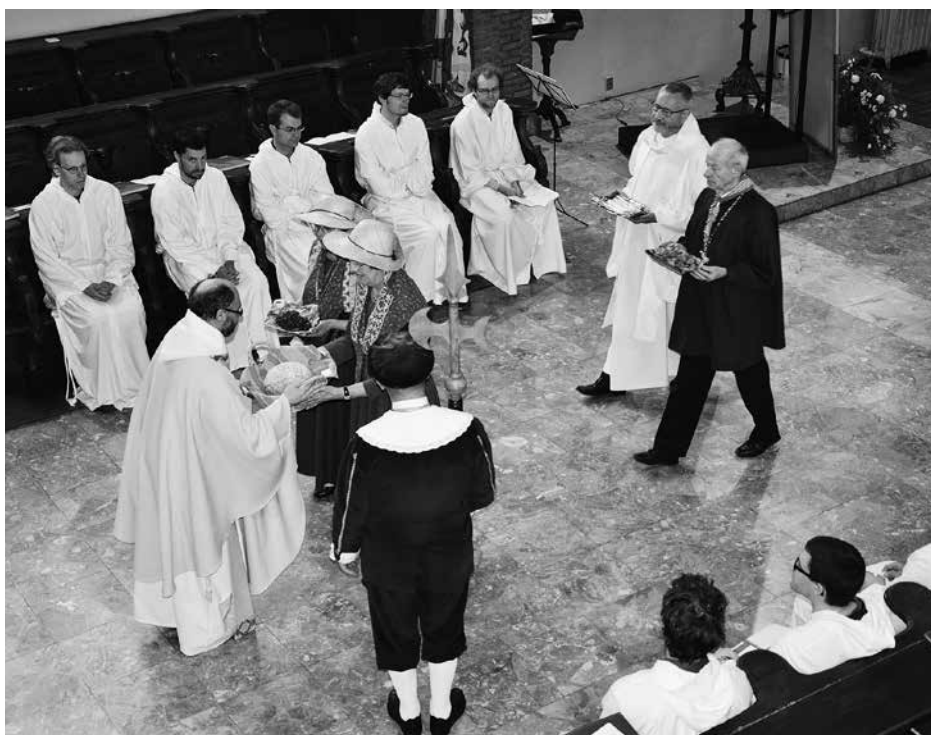
Gildebreeders en -zusters brengen gaven aan – vruchten van hun arbeid – tijdens de eucharistieviering n.a.v. het jubileum van de Hoge Gildeeraad van Brabant in abdij Keizersberg, 2014.

aan in de eucharistie. Zij dragen op wat zij in hun tuinen konden laten groeien dankzij Gods gave van de schepping en van hun eigen werk dat als een stroom ter bevloeiing kan worden beschouwd. Maar God is in de liturgie tevens onvoorwaardelijk en onbegrensd aanwezig in de zelfgave van zijn Zoon, zoals Hij dat is in de allegorische regen van Teresa. Het is trouwens ook niet door onze eigen verdiensten, ons gebed of onze juiste uitvoering van de rituelen en rubrieken dat wij Gods genade ontvangen en van zijn aanwezigheid kunnen genieten, maar het is God die zichzelf gegeven heeft, nog geeft en blijft geven. In dit verband schreef Joseph Ratzinger in 2003, luttele jaren voor hij de Heilige Stoel bekleedde als paus Benedictus XVI: