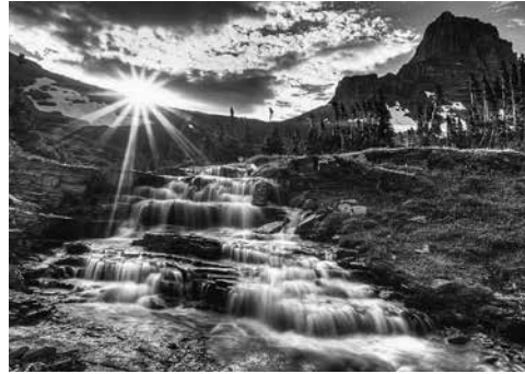
“Overal waar de rivier langs kwam, schoot groen gewas op.” (Ez. 24)

doet.” (TA 147) Teresa gaat verder: “En wat de arme ziel in een twintigtal jaren niet zou kunnen bereiken met haar arbeid om het intellect tot rust te brengen, volbrengt deze hemelse tuinman in een ogenblik.” (TA 152) Dat leidt dan tot de vierde en laatste etappe: God geeft zijn genade als regen, zonder enige arbeid van de biddende tuinman. “In dit vierde stadium is de ziel niet in het bezit van haar zintuigen, maar zij verheugt zich zonder echt te begrijpen waarover zij zich verheugt.” (TA 157)