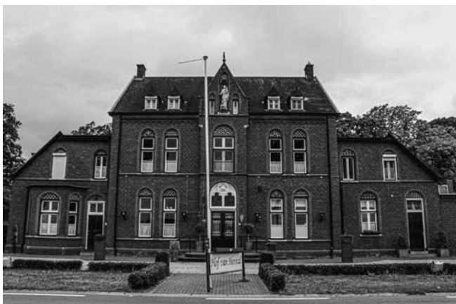
Restaurant 'Hof van Herstal', voorheen het vrouwenverblijf van de abdij en het Sint-Jozefhotel.