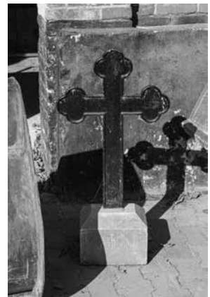
Kloosterhof en kerkhof tegelijk; kruisen voor de monniken, zerken voor de abten.