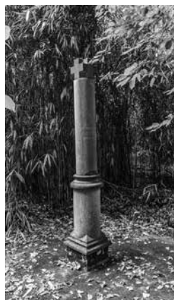
Memento voor het Sint-Bernarduscollege.

Bruggeman. Er is nu geen band meer met de abdij, buiten enige inspiratie voor het menu. Het restaurant is een beetje afgelegen van de openbare drukte, zoals dat in de nabijheid van een cisterciënzerabdij betaamt. En dan is er ten slotte ook nog een monument ter nagedachtenis aan gesneuvelde geallieerde vliegtuigbemanningen. Het doet ons stilstaan bij de ellende die elke oorlog teweegbrengt.