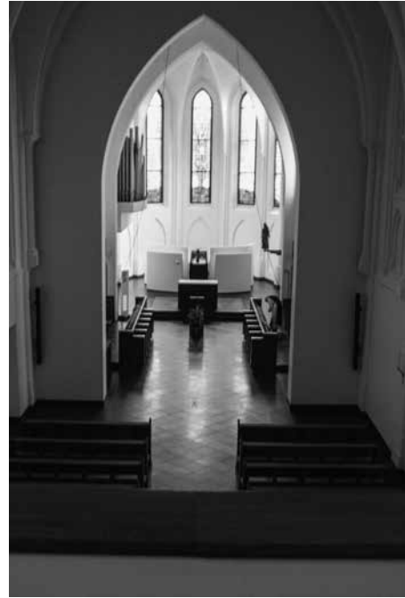
Dakspant in het gastenkwartier met stichtende spreuken; het hoogkoor van Lilbosch.