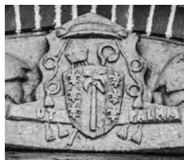
De abdijhoeve van Lilbosch, de bouwnaadzone (60 jaar bouwverschil), het wapenschild.