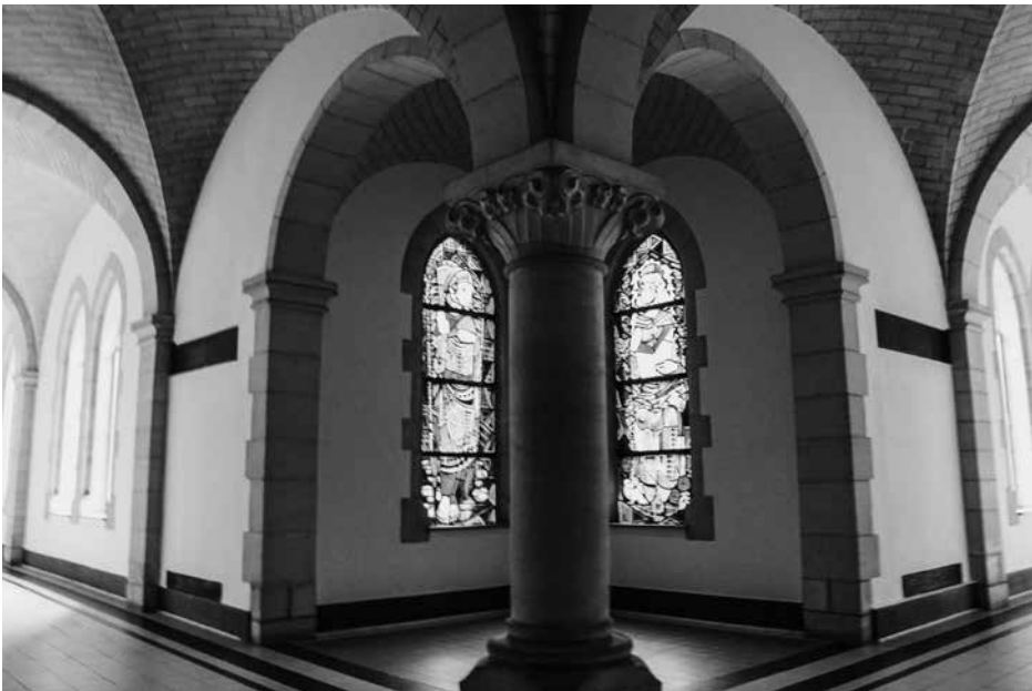
Pandgang van de abdij Lilbosch.