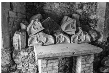
Kapel aan de zijkant van de (nieuwe) abdiijkerk.