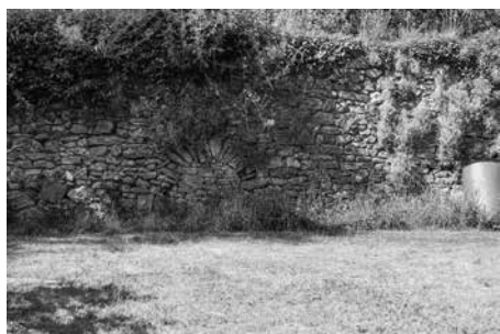
De reredorter.