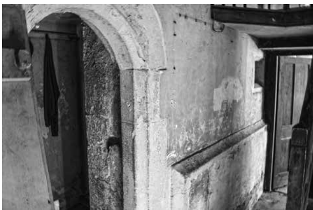
Zijdeur van het Sint Andreas poortgebouw. Priesterdeur met inijkraam in de Sint Andreas poortkapel.