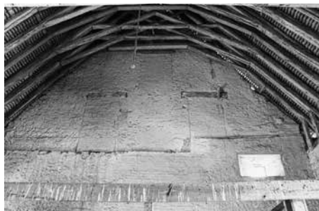
De abdijschuur (ook wel hospitium genoemd) van Boxley.