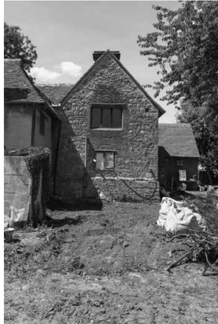
Poortgebouw Sint Andreas. Sporen van een gotisch boogvenster in het bouwwerk.

De kern van de poortkapel is momenteel weer traceerbaar. Daarbij valt vooral de aanwezigheid op van twee hagioscopes : kijkgaten langs beide kanten van de kapel om de hostie of het relik te kunnen aanschouwen. De deuropening voor de kapelaan is eveneens nog aanwezig, evenals het (dichtgemetselde) boograam. De poortkapel bood voorbijgangers die niet welkom waren in de abdij een religieus steunpunt aan. Het hele poortcomplex betekende voor de monniken ook een soort spirituele verdedigingslijn tegen de slechte invloeden van de wereld. Voor mensen die wel naar de abdij mochten was de buitenpoort (met kapel) een baken. Zodra ze die buitenpoort bereikten, wisten ze dat ze nog slechts enkele tientallen meters moesten wandelen vooraleer ze aan de binnenpoort kwamen. Ideaal om zich tussen beide poorten – een soort van purgatorium – te bezinnen. De herstellingswerken die de SPAB aan de Sint Andreaskapel uitvoert zorgt dus niet alleen voor een monumentale meerwaarde, ze geven ook aan dat een (middeleeuws) cisterciënzerdomein tot op vandaag meerwaarde biedt, zowel voor spirituele overpeinzingen, historisch onderzoek als herbestemming en toetsing van restauratietechnieken.