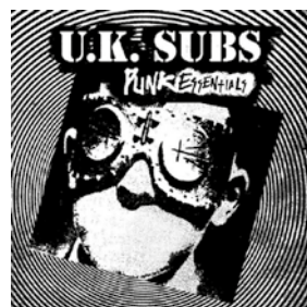
Hoesje van het album Punk Essentials uit 2013 onder het label New Red Archives.

We nemen de proef op de som en gaan in dialoog met een van de centrale figuren die aan de oorsprong van de punkbeweging in Engeland hebben gestaan: CHARLIE HARPER, zanger van de legendarische band UK Subs. Hij werd in 1944 in Londen geboren. In 1976 richtte hij de band op. Op z’n 32 ste was hij al een veteraan van de Londense blues-scène. Voorheen werkte HARPER in een kapsalon, maar hij ging vanaf dat moment helemaal voor de muziek. In 1979 verscheen Another Kind of Blues , het eerste album van de band dat hoge toppen scheerde in de Britse hitlijsten. Met diverse hit-