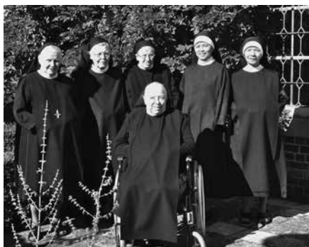
De Sint-Godelieveabdij aan de Brugse Boeveriestraat en de benedictinessen kort voor hun vertrek in 2013.

Sint-Godelieveabdij is nog niet helemaal uitgekristalliseerd. De abdij werd door Toerisme Vlaanderen in erfpacht genomen tot 2066 en wordt als de Tuin van Heden, een in Brugge gewortelde beheersstructuur die ook het kapucijnenklooster in de Boeveriestraat onder haar hoede heeft, herbestemd en toeristisch ontsloten. Een spanningsveld dat symbolisch perfect samenvalt met de hobbelijke abdijschiedenis en de heilige die er werd vereerd.