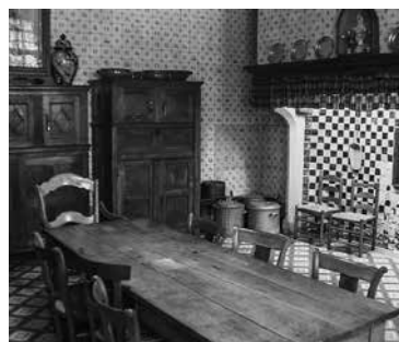
De Sint-Godelieveabdij, verstilde pracht aan de stadswallen van Brugge.

vluchtte de gemeenschap naar het benedictinessenklooster van Maredret. De toestroom aan studentes in Brugge maakte het na de Tweede Wereldoorlog interessant om de formule van kamerverhuur weer tot leven te wekken. In het home Sinte-Godelieve konden dertig meisjes in een pedasysteem ondergebracht worden. Ondertussen bleef de strikte clausuur gehandhaafd, tot grote spijt van tal van cultuurtoeristen die in de 19 de en 20 ste eeuw Brugge bezochten. 12