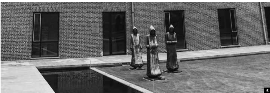
1. D'Abdij , Centrum van de diocesane onderwijsdiensten. 2. Glasramen van Roderburg in d'Abdij . 3. Bedrijvigheid in het onderwijscentrum. 4. Beelden van Scholastica en Benedictus in de refter van d'Abdij . 5. De binnentuin van d'Abdij met de drie bronzen 'wandellmonniken' van Martine Bossuyt.

maar binnenin heerst er volop bedrijvigheid, althans tijdens de kantooruren. De herinnering aan het initiële gebruik van het gebouw is met het nodige respect behouden en geïntegreerd in het nieuwe concept. Misschien moeten er alleen nog wat zonnebloemen komen. 7