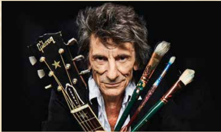
Ronnie Wood: twee passies.

titel Guitar & Horse Study , waarop een paard en een gitaar één figuur vormen. Gitaar en paard lopen niet alleen in elkaar over, ze vormen ook elkaars corpus. Het een zou zonder het andere niet kunnen bestaan. Het gaat hier om twee objecten die in de schilderijen van Wood vaak voorkomen, maar nooit eerder met elkaar versmolten. De twee schilderijen verschillen lichtjes qua donkerte, en de ene keer is de staart van het paard natuurlijk, de andere keer is het de hals van de gitaar. Beide keren zijn de twee objecten één: in onstuimige harmonie.