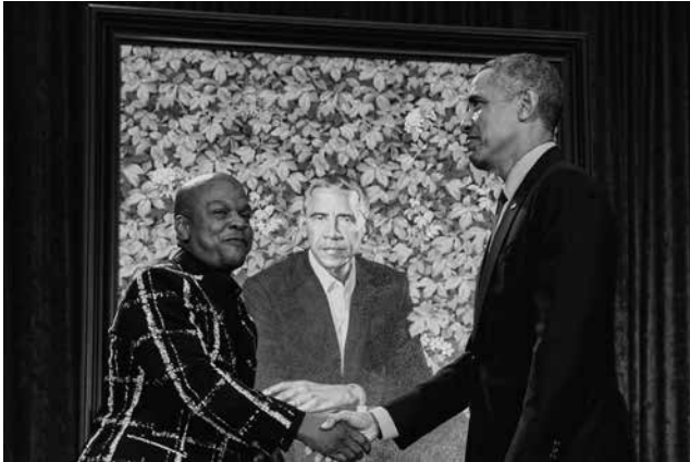
Kehinde Wiley met voormalig president Barack Obama bij de overhandiging van het staatsieportret van Obama, februari 2018.

Hij laat zijn modellen kiezen uit portretten van edelen en koningen, heersers en heiligen, generaals en middeleeuwse patriciërs.