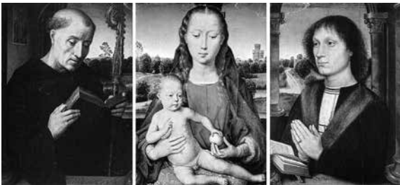
Kehinde Wiley, Memling: After Memling's Portrait of St. Benedict , olie op paneel, 2013. (Hiernaast is de originele triptiek van Hans Memling afgebeeld, met links de heilige Benedictus en rechts Benedetto Portinari)