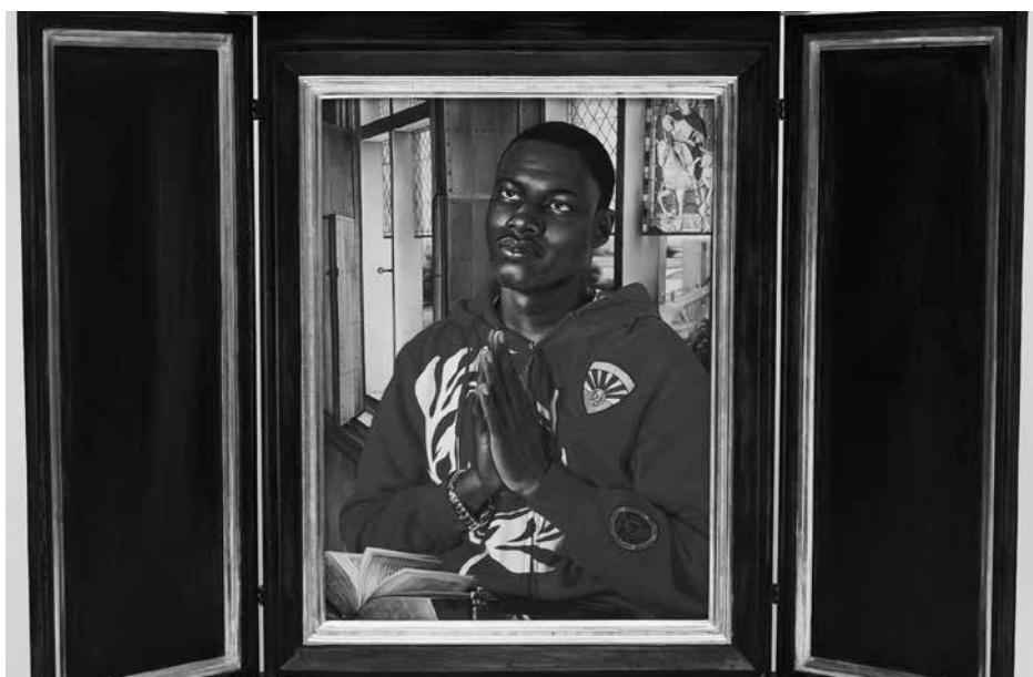
Kehinde Wiley, Memling: After Memling's Portrait of Maarten van Nieuwenhove , olie op paneel, 2013.

valt onmiddellijk op hoe de zwarte jongeman straalt. De donkere huidskleuren zijn virtuoos geschilderd en het gehele doek is opgebouwd uit een stralend kleurenpalet. Waar de Maarten van Nieuwenhove van Memling een paars-mauve hemd draagt met een zwartbruine mantel erover, wat een zekere noblesse en chic heeft en ingetogenheid uitademt, heeft de Maarten van Nieuwenhove van Wiley