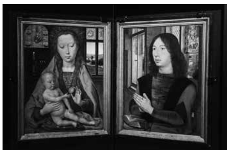
De originele diptiek van Hans Memling.

Wat laat Wiley zien? Een zwarte jonge man in een felrode sweater met een (zilveren) armband (of horloge?). Het geschilderde personage bevindt zich in de setting van het Maarten van Nieuwenhove-portret van Memling: twee ramen achter zich, een glasraam met Sint-Maarten, een opengeslagen boek met goudsnede. De jonge man houdt de handen vroom bijeen, net zoals het Memling-model dat 500 jaar tevoren deed, en hij kijkt lichtjes naar omhoog. Het