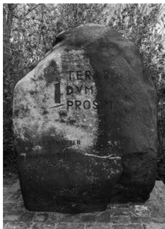
De gedenksteen van Klaarkamp.