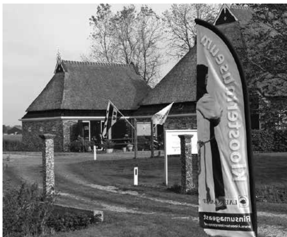
Claercamp Museum.

len centimeters onder het maaiveld afgebroken. Daarmee was een einde gekomen aan een lang verdoken gebleven funderingsrelict. 6