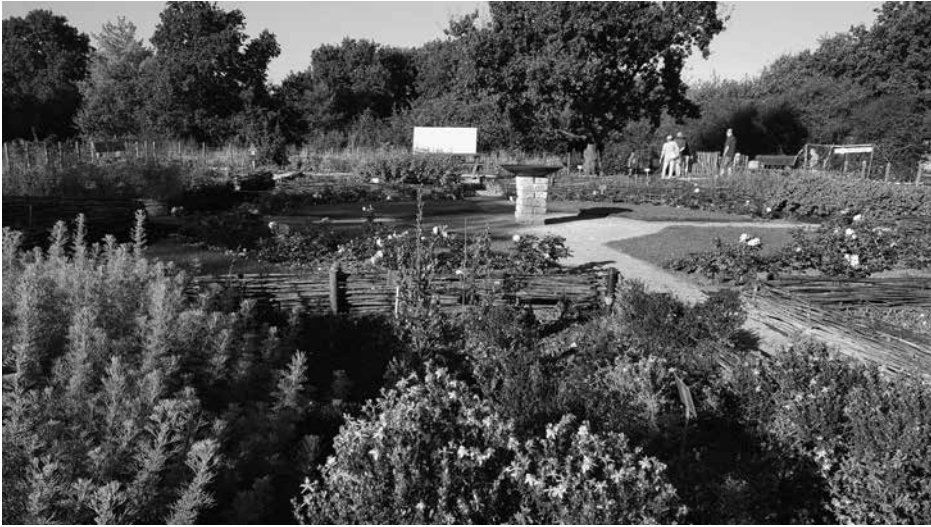
De kloostertuin van Sibculo.

Die herbronning mondde uit in de Moderne Devotie die voortbouwde op de inzichten van Geert Grote en zijn volgelingen, de broeders en zusters des gemenen levens .