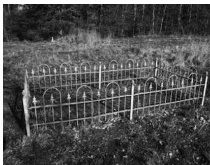
Grafzerk in de kloostertuin, 1501.

In 1928 werd een deel van het kloosterpand opgegraven voor de Enschedese textielbaron Van Heek. Een deel van de toen opgedolven bouwmaterialen werd midden jaren 1950 gebruikt voor de bouw van een kapel in Oud-Borne. Sinds 1972 is het terrein beschermd onder de monumentenwet. De open ruimte wordt thans door de Stichting Klooster Sibculo gepromoot. Een museum werd opgericht, onder andere met vondsten uit de opgravingen van de jaren 1920. Omdat het landschap nu eenmaal een belangrijk baken is, maakte men ook werk van een kloostertuin. Het ontwerp daarvan is van de hand van biologe Tini Brugge die vanuit haar eigen christelijke spiritualiteit een moderne kloostertuin ontwierp, gelegen aan de zuidkant van de vroegere kloosterkerk: de perfecte aanzet tot een ruimere herdenkingsplaats. Kortom, Sibculo is een lieu de mémoire die uitnodigt tot contemplatie naast de grafzerk van de verder onbekende Gurte Heiteweggen. 20