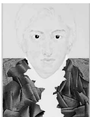
Bernadet ten Hove, William Turner (Present Presence) , acryl, lakverf en vilt op aluminium.