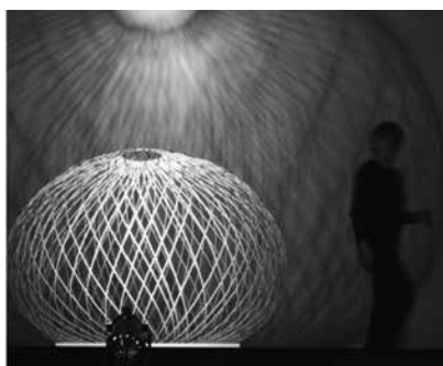
Maria Blaisse, Breathing Sphere , bamboe.