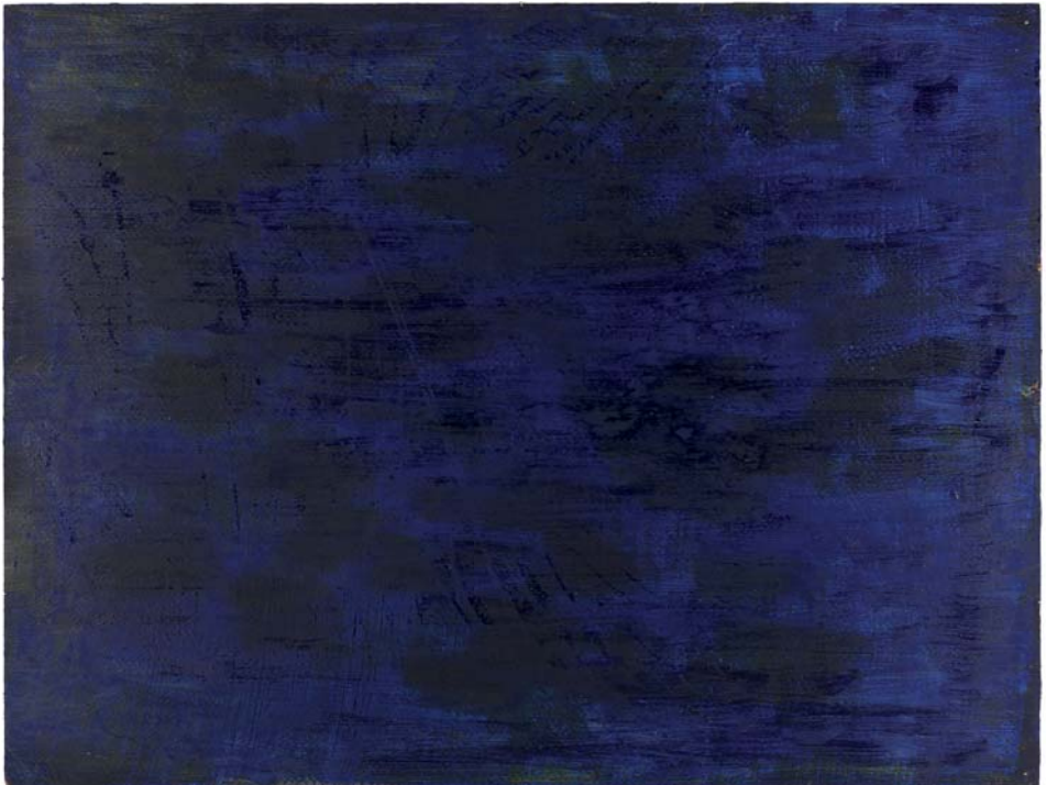
De diepte van het water , olieverf op papier, 2013, 42 x 61 cm.