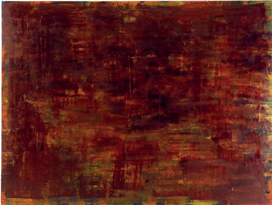
Geronnen bloed , olieverf op papier, 2013, 42 x 61 cm.