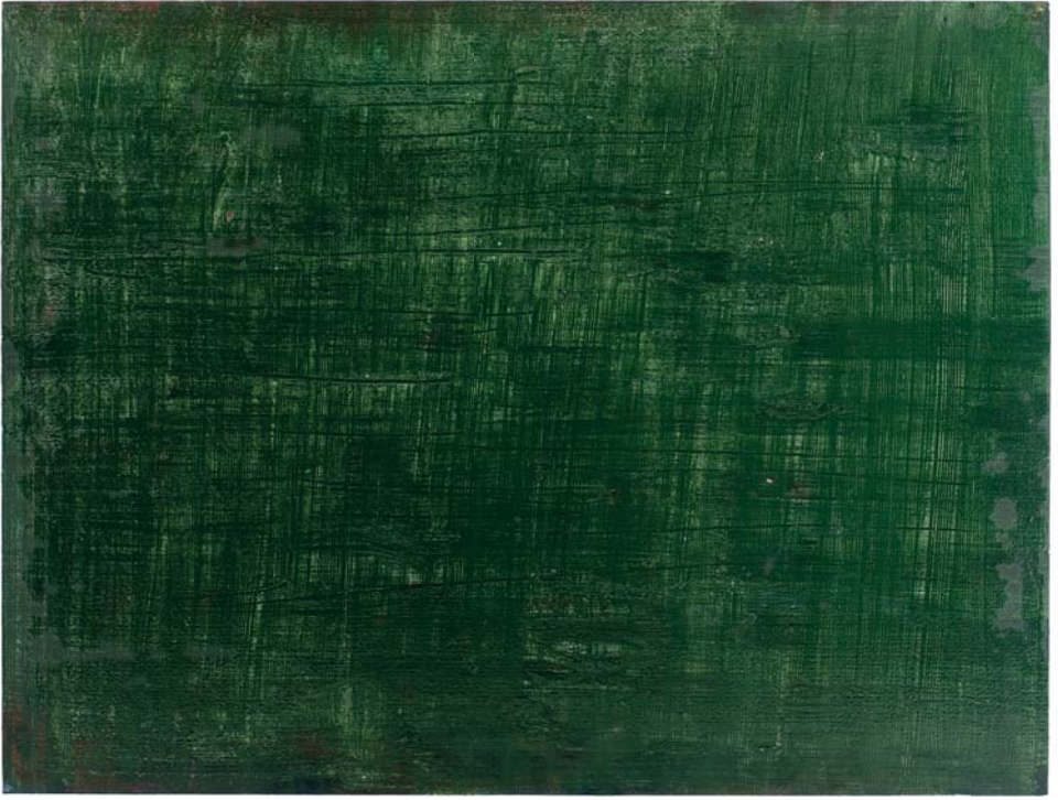
Viriditas , olieverf op papier, 2013, 42 x 61 cm.