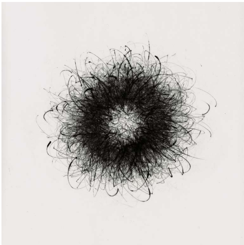
Els Vos, Intra cucullam amoris