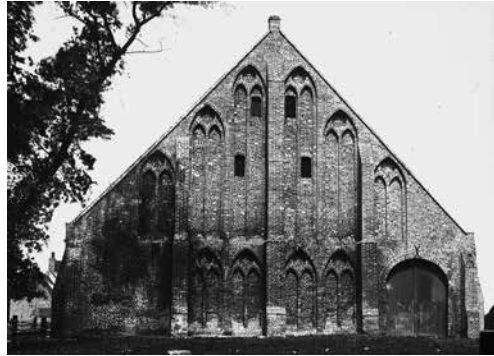
Monumentale graanschuur van Ter Doest in Lissewege.

gen. Het huidige Catharijneconvent in Utrecht is nu bekend als museum voor christelijke religieuze kunst en geschiedenis. In deze oude bisschopsstad was het oorspronkelijk een opvanghuis voor daklozen, dat nadien een karmelieten- en johannietersklooster werd. Hun hospitaal werd in 1580 gewoon gecontinueerd door de stedelijke overheid tot in 1811. Daarna was de site volledig of gedeeltelijk in gebruik als kazerne, gymnastiekzaal, Belgische vluchtelingenopvang (WO I), werkgelegenheidskantoor, opslagplaats en museum. 10