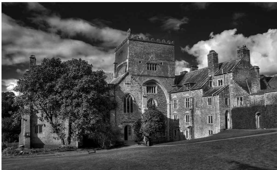
De tot landhuis omgebouwde Buckland Abbey in Devon (U.K.).

de abdijrestanten zijn er een onderdeel van de watertuin van Studley Royal en vormen samen een World Heritage Site. Meestal vielen de niet bruikbare abdijgebouwen onder de sloophamer en werd de rest volledig geïntegreerd in het nieuwe landhuis, zoals dat gebeurde met Netley Abbey in Hampshire (in de 19 de eeuw gerestaureerd tot een perfecte middeleeuwse ruïne) of met Buckland Abbey bij Yelverton (Devon), in de 16 de eeuw verbouwd door achtereenvolgens Sir Richard Grenville en Sir Francis Drake, beide ontdekkingsreizigers. Maar niet elke nieuwe adellijke eigenaar kon zo'n grootschalig project financieren, zodat sommige erfgoeden een minimale verbouwing tot woning kregen, zoals de abdijsite van Boxley in Kent, oorspronkelijk gesticht door de 12 de -eeuwse edelman William van Ieper.