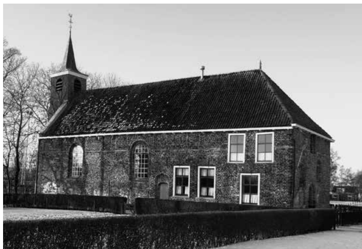
De brouwerij van het Gerkesklooster, herbestemd tot protestants gebedshuis.