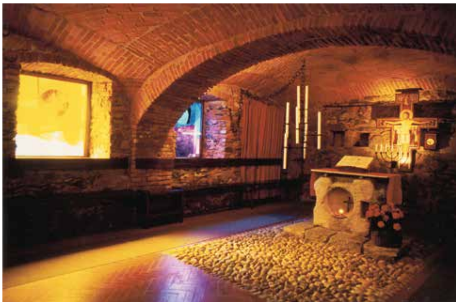
De kapel van Bose.

religieuzen en leken, kennis met de weg die de broeders en zusters van Bose kozen, en met de verfrissende wind die in het spoor van het Tweede Vaticaans Concilie die gemeenschap begeesterde.