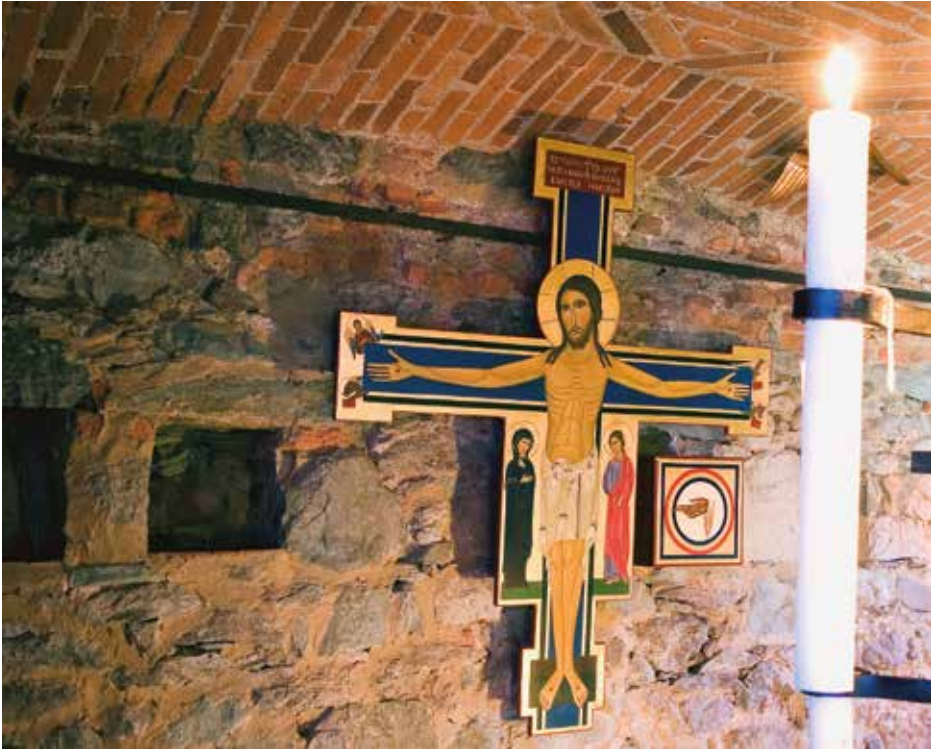
Crucifix in de kapel van Bose.

het celibaat veeleer zeldzaam en tegendraads, maar niet onmogelijk. Jezus haalde er zich wel de vijandigheid van zijn eigen familie mee op de hals. Over twee uitdrukkingen van Jezus, namelijk het ‘haten van vader en moeder, broers en zusters...’ en de ‘eunuchen die zichzelf onhuwbaar hebben gemaakt voor het Rijk der Hemelen’ lezen we bij Enzo Bianchi een bondige, maar heldere duiding. Ook de voorkeur die Paulus in 1 Kor 7 uitspreekt, wordt genuanceerd toegelicht.