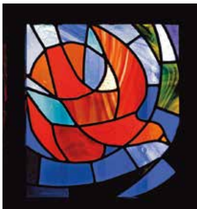
Glasraam met gestileerd motief van de heilige Geest in de kapel van Bose.