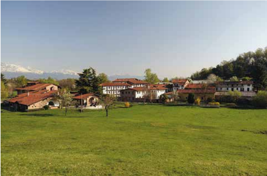
Het gebouwencomplex van de gemeenschap van Bose.

de kop in te drukken dat religieuzen een geprivilegieerde plaats in de Kerk hebben en model staan voor elk type van christelijk leven. Wij zijn niet beter. Religieus leven in de Kerk, onder de mensen , luidde dan ook de titel. 3