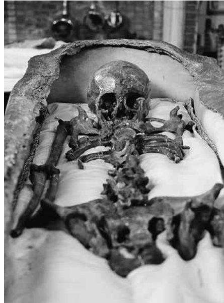
Skeletresten van de zalige Idesbald?

Toen de monniken in 1627 verhuisden naar hun nieuwe abdij aan de Brugse Potterierei, namen zij de relieken van Idesbald mee. De devotie voor de abt werd er nog aangezwengeld door prior Nivardus van Hove, die in 1687 een eerste gedrukte biografie over Idesbald uitgaf. Tijdens de Franse periode werd de lijk-kist met inhoud angstvallig verstopt en in 1831 plechtig herbegraven in de Onze-Lieve-Vrouw-ter-Potteriekerk, waar