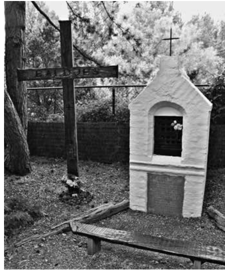
Kapelletje van de zalige Idesbald in Koksijde.

Dat essentiële is de volgehouden betrachtning een brokje heiligheid in het leven van elke dag te verwerven. Of je dat nu doet terwijl je in een twaalfde-eeuws lijf huist, in een vijftiende-eeuws lichaam woont of in dat van een mens die het derde millennium binnentrad – veel verschil maakt het allemaal niet uit. Welbeschouwd is het een zegen voor de reliekverering dat de echte Sint-Idesbald tot nader order onnaspeurbaar blijft. Nu de teerbemimde abt van de Duinenabdij weer zoek is, beseffen we des te beter