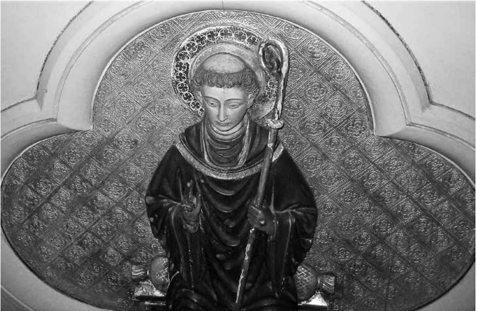
Afbeelding van de zalige Idesbald, zijkant van de rijve in de kerk van de Potterie in Brugge.

secretaris van de abt. Het is dan ook niet verwonderlijk dat Idesbald in 1155 door zijn medebroeders tot abt werd verkozen. Hij was de eerste monnik uit de eigen gemeenschap die deze eer te beurt viel. De eerste twee cisterciënzerabten kwamen immers uit Clairvaux en keerden na hun mandaat terug naar hun moederabdij. Onder Idesbalds bestuur kende de Duinenabdij een economische groei. Zo verwierven de monniken enkele nieuwe domeinen en knoopten ze handelsbetrekkingen met Engeland aan.