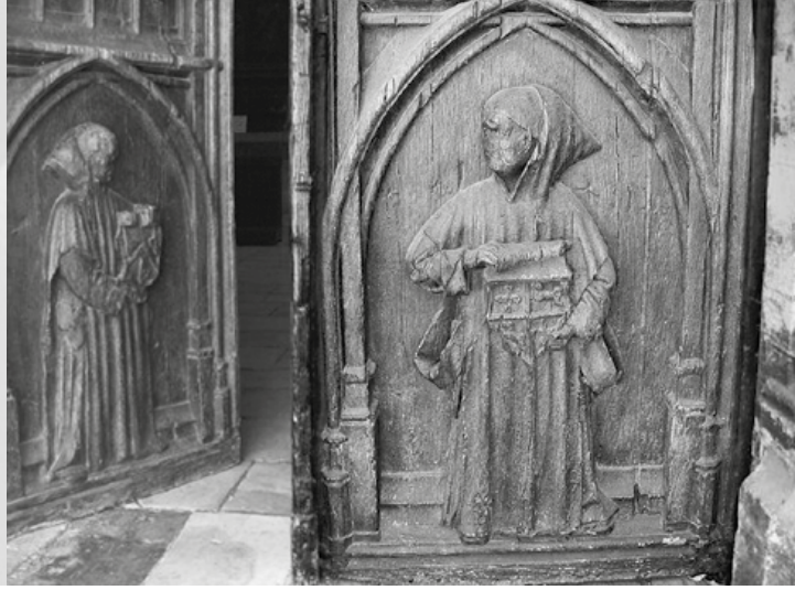
Kloosterdeur van de Chartreuse Saint Sauveur in Villefranche-de-Rouergue (F).