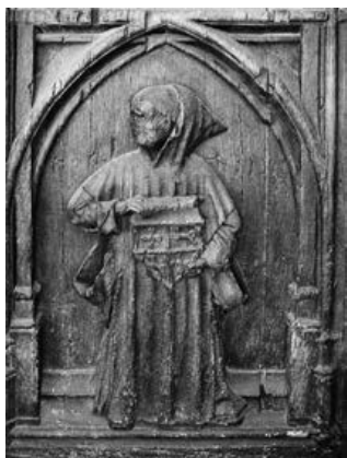
Chartreuse Saint Sauveur

Wat belet de flexibele mens van vandaag om hier geloof aan te hechten? Staat ook zijn levensloop niet tot het einde toe open? Toch is de spirituele openheid nog ruimer dan die van de wereld. Ze blijft in stand tot de tijden zijn vervuld, tot de parousie heerst die geen mens zelf kan bewerkstelligen. Precies die grote openheid maakt het mogelijk om je eigen ego, je sociale zekerheid en je maatschappelijke positie keer op keer los te laten als dat nodig is. Meer nog, klamp je je eraan vast, dan verlies je het ultieme perspectief uit het oog.