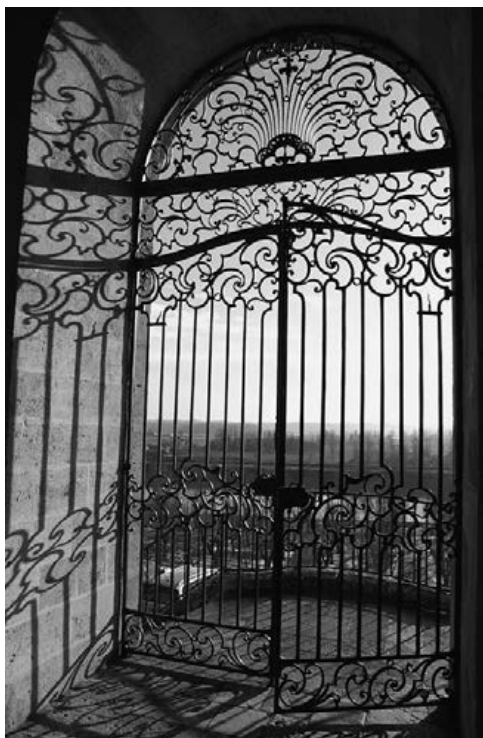
Porte Blaise Charlut in de oude benedictijnenpriorij in La Reole (Aquitanië).

“liefde tot Christus” en het perspectief van het “eeuwig leven” (RB 72,11-12) waarvoor het eigenbelang moet wijken.