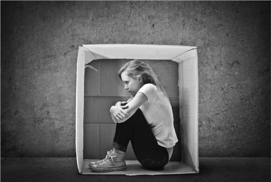
Angst: een slechte leermeester.

terrorisme van vandaag. En daarom moet waakzaamheid hand in hand gaan met nuchterheid.