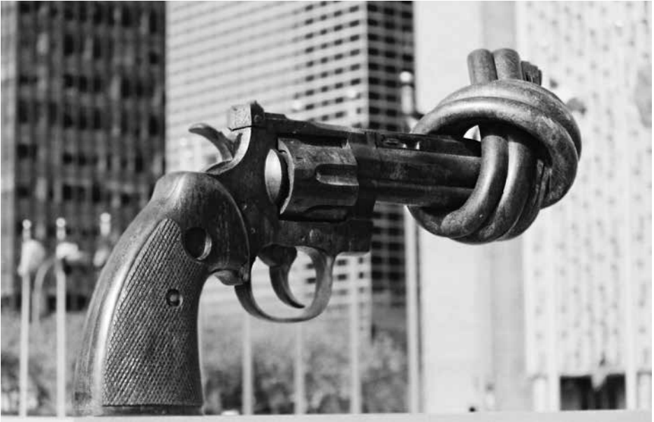
Bronzen beeld als symbool van vrede bij de Verenigde Naties in New York, gemaakt door Karl Fredrik Reuterswärd. © foto: Michos Tzovaras.

twijfel, van onze vrees voor anderen die nochtans genieten van diezelfde zon die ons haar warmte en levensvreugde schenkt. De zon is de geest van de goede, scheppende gedachte. Ze is het symbool van de waakzaamheid voor de voleinding van de wereld en de definitieve doorbraak van het koninkrijk van de Heer van het heelal.