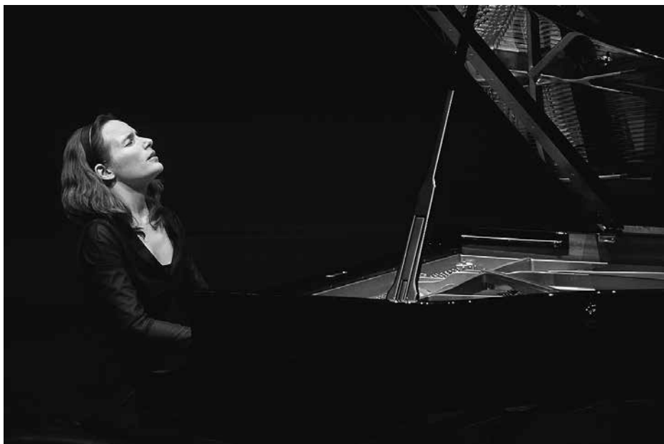
Pianiste Hélène Grimaud aan het werk.

De pianiste heet Hélène Grimaud. Ze werd in 1969 in Frankrijk geboren. Ze wordt ook wel de ‘filosofe achter de piano’ genoemd, omdat zij muziek ervaart als een manier om de wereld te verkennen en te doorgronden. Hélène begon als kind piano te spelen om haar energie wat in te tomen. Vanaf dat moment had ze geen last meer van agressieve buien: ze vond haar evenwicht in het pianospel. Het werd haar hoogsteigen levenswijze.