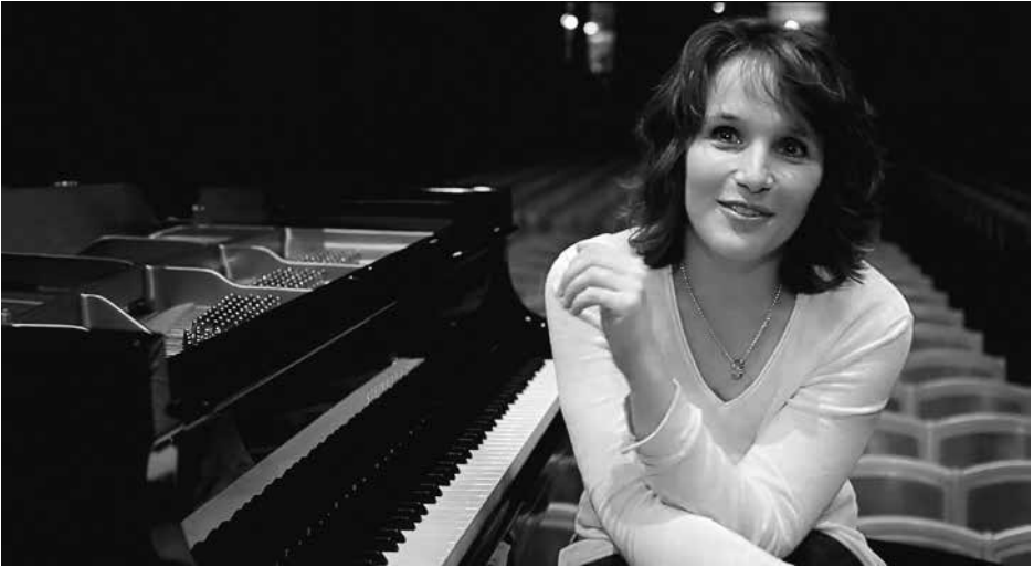
Hélène Grimaud.

zijn volgeling immers niet tot het vinden van een goede balans om er alleen maar een kalm gemoed aan over te houden. Die balans is er om “voor het aanschijn van de Godheid en zijn engelen” (RB 19,6) te kunnen staan.