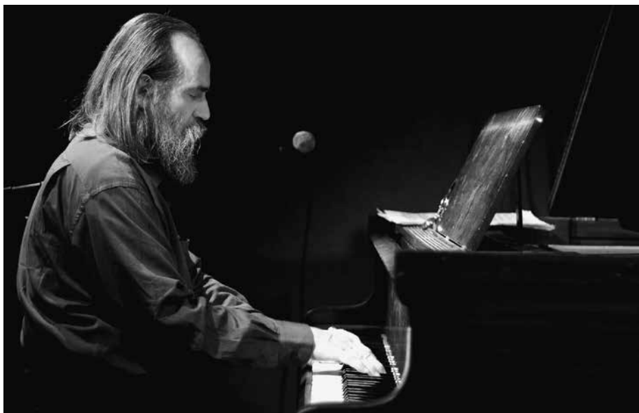
Lubomyr Melnyk aan het werk tijdens een concert.

Maar wat bij hem duizelingwekkend klinkt, vormt tegelijk een zacht omhulsel, een grot van rust. Wonderlijk hoe deze indruk ontstaat door die snelle vingerzettingen in een op eerste gehoor bijzonder onrustig spel.