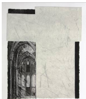
Els Vos, De ruimte van de eenvoud , ets, 40 x 70 cm.

Eenvoud is niet eenvoudig te omschrijven. Het begrip kan staan voor ongekunsteld gedrag, integere wandel, harmonie, innerlijke vrede of soberheid. Eenvoud wordt met waarheid, goedheid en schoonheid geassocieerd. En met geluk, zeker in tijden van nood en verwarring. Maar wat er ook van moge zijn, geen beter gids en leefkader dan die van Bijbel en abdij om te ontdekken dat eenvoud goud waard is. Een kunsttentoonstelling en een boekuitgave willen die wijsheid uit Schrift en klooster ontsluiten.