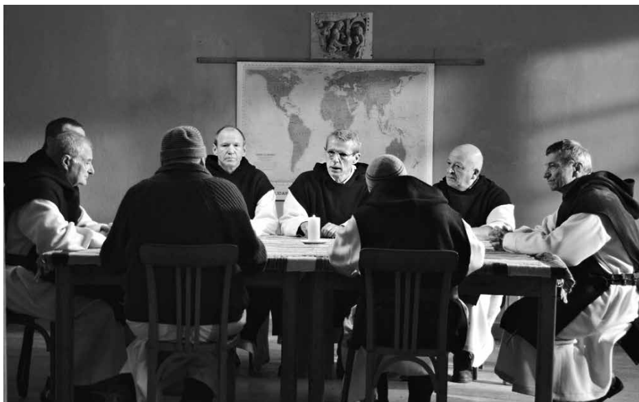
Overleg in het klooster van Tibhirine, met frère Christian de Chergé (Lambert Wilson) op de centrale plek aan tafel. Momentopname uit de film Des hommes et des dieux .

heeft aan martelaren maar aan monniken. De repliek van de prior luidde: “Het ene impliceert het andere.”