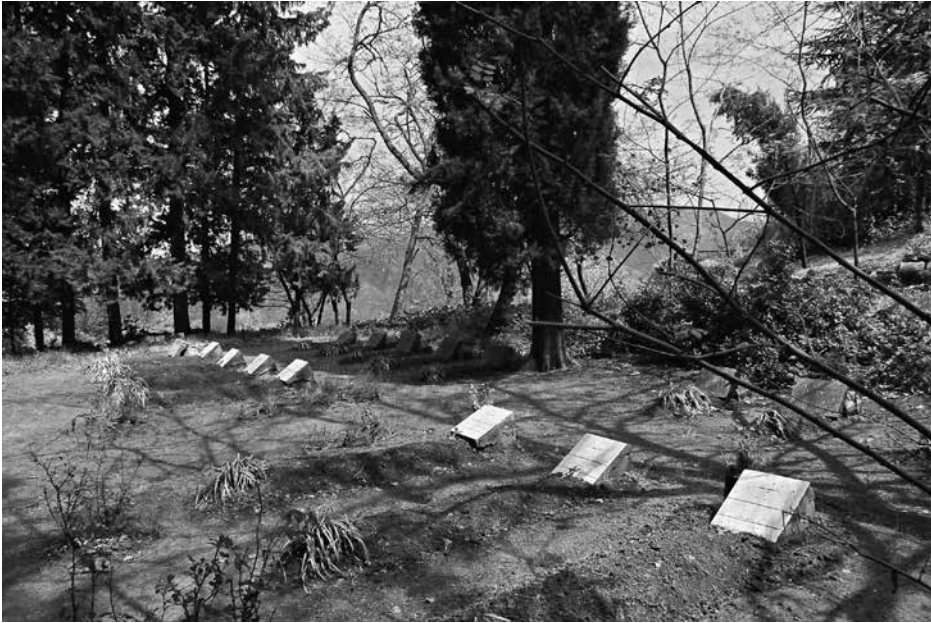
De tuin van de priorij Notre-Dame de l'Atlas in Tibhirine, met de graven van de vermoorde monniken.

authentiek en toch volledig aangepast aan de specifieke socio-religieuze context. Anderzijds springt de diepe vreugde om een gedeeld leven in samen-horigheid met de lokale bevolking in het oog. Het diep gewortelde humanisme van de broeders uitte zich in nederige dienstbaarheid jegens de buren, de dorpsbewoners en al wie aanklopte bij het klooster. Dat was de ware inter-religieuze dialoog die al enkele decennia bestond, nog voor die andere dialoog, die het eerder moet hebben van intellectuele en spirituele uitwisselingsessies, overal tot ontwikkeling kwam.