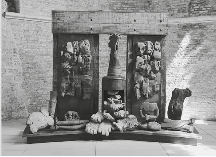
Anthony Caro, De schepping van de mens , Eglise Saint-Jean Baptiste, Bourbourg (F), 2008.

“kleren van huiden” (cf. Gn 3,21) noodzakelijk maakt. Hij schrijft daarover in zijn Grote catechetische rede :