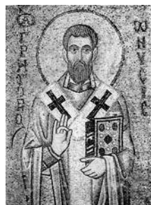
Gregorius van Nyssa, mozaïek uit de 11de eeuw.