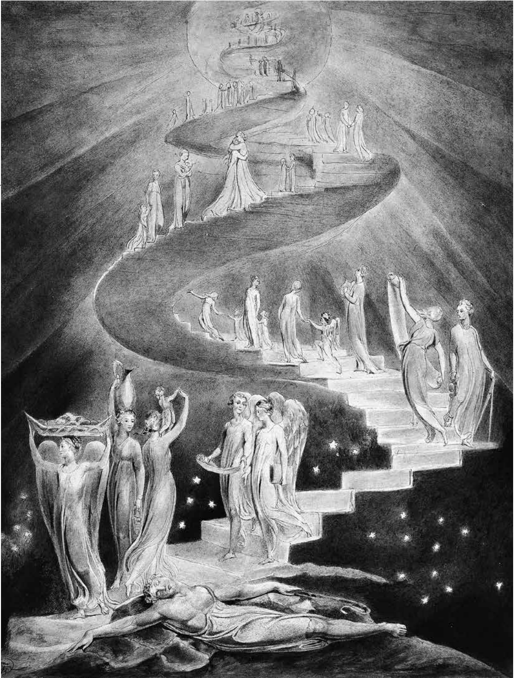
William Blake, De Jakobsladder of Jakobs droom , inkt en waterverf, 1805, Britisch Museum, Londen.