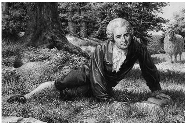
Jean-Jacques Rousseau liggend in een schapenweide.

komt het omgekeerde wel vaker voor: meditatie eindigt in dromerij, waarbij de ziel “doorheen het heelal dwaalt en zweeft op de vleugels der verbeelding, in een extase die alle andere vormen van genot overstijgt”.