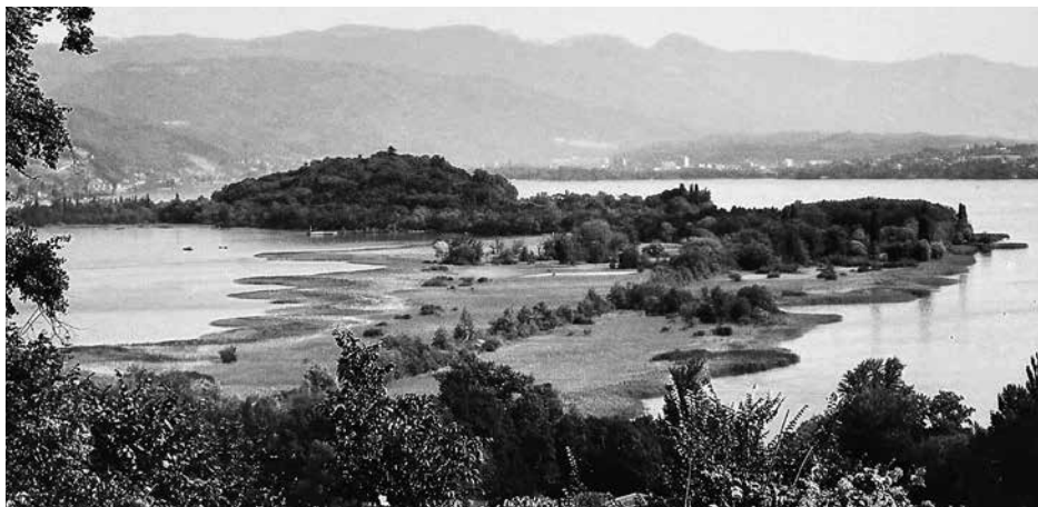
Lac de Biemme (Bielensee) met Île Saint-Pierre (Sankt Petersinsel), Zwitserland.

Rousseau vermeldt ook hoe op het eiland zijn liefde voor planten begon te ontwikkelen en dat hij heel wat tijd uittrok om de natuur aandachtig te observeren. Soms maakten hij en zijn levensgezellin Thérèse een tochtje door de velden en de boomgaarden, waar ze hun gastheer, zijn gezin en hun personeel een handje konden toesteken. Rousseau vertelt echter ook hoe hij, na het middageten, vaak stiekem wegglipte. Hij trok dan met een bootje op het meer, om er languit liggend naar de hemel te staren en zijn gedachten de vrije loop te laten. Liet het weer zo iets niet toe, dan kuierde hij maar wat langs de oevers waar hij vaak iets onverwachts aantrof.