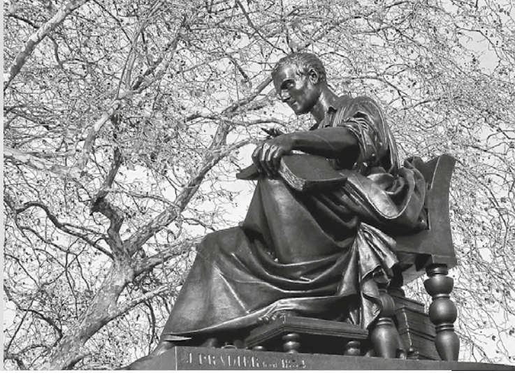
Standbeeld van Jean-Jacques Rousseau (beeldhouwer: James Pradier, 1835) in Genève (Île Rousseau).

Ook de verlichtingsfilosoof Jean-Jacques Rousseau (1712-1778) mag aan het lijstje worden toegevoegd. Die laatste vond het naar het einde van zijn leven welletjes. Ontgoocheld over een samenleving waarmee hij zo vaak overhoop lag, zocht hij een rustige omgeving, ver van het wereldse gewoel, om er te genieten van wat het leven hem nog te bieden had. Hoewel hij die tijd niet in absolute eenzaamheid doorbracht, verkoos Rousseau toch vaak alleen te zijn. Dit soort situaties duidde hij graag aan met termen als ‘eenzaamheid’ of aanverwante woorden.