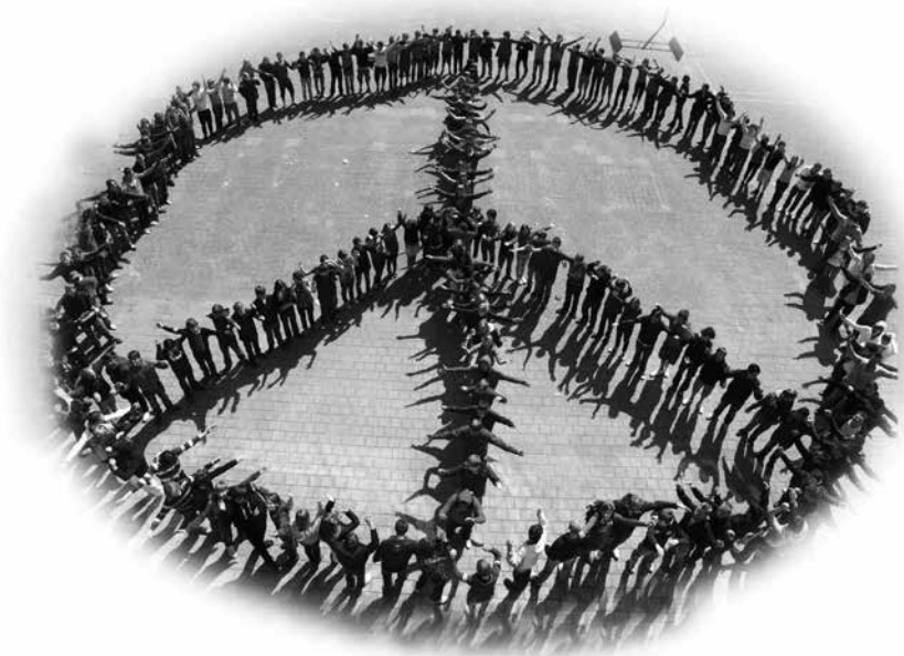
Campagnefoto voor de Vlaamse Vredesweek.

Een levensstijl die voortkomt uit een obsessief consumentisme, vooral bij mensen die het zich kunnen veroorloven in dit gedrag te volharden, kan alleen maar leiden tot geweld en wederzijdse vernietiging. (§ 204)