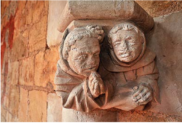
'Broederliefde' in de cisterciënzerabdij van Cadouin (Dordogne). De abdij werd in 1115 gesticht.