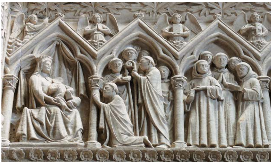
Grafmonument voor de stichter van de abdij van Obazine. Het stenen basreliëf op het dak van de tombe toont cisterciënzers die de H. Maagd vereren.

teksten van Stephanus, geen uitwerking van een eigen weg. De Carta is immers zelf deel van de weg. In de eerste drie paragrafen, de oudste kern van het document, komt de visie van Stephanus het duidelijkst naar voren. Alles staat er in het teken van de eenheid. Dat blijkt al uit de aanhef van de eerste paragraaf: de leden van de cisterciënzerorde worden nutteloze knechten “van de ene ware koning, heer en meester” genoemd. De eenheid van God, maar dan in zijn drievoudige verschijningsvorm van koning (Vader), heer (Zoon) en meester (Geest), garandeert de eenheid van de orde die zich over de wereld begint te verspreiden. Typerend voor Stephanus is de groeiende concrete nabijheid in deze bepaling: van de verre onbereikbare Vorst via de nedergedaalde en weer opgestegen Heer naar het blijvende meesterschap van de Geest dat zich in de aardse meesters manifesteert.