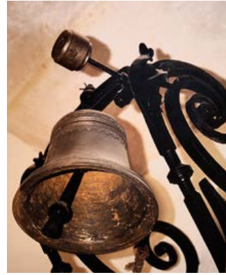
Binnenhuisklok in de abdij van Cîteaux.