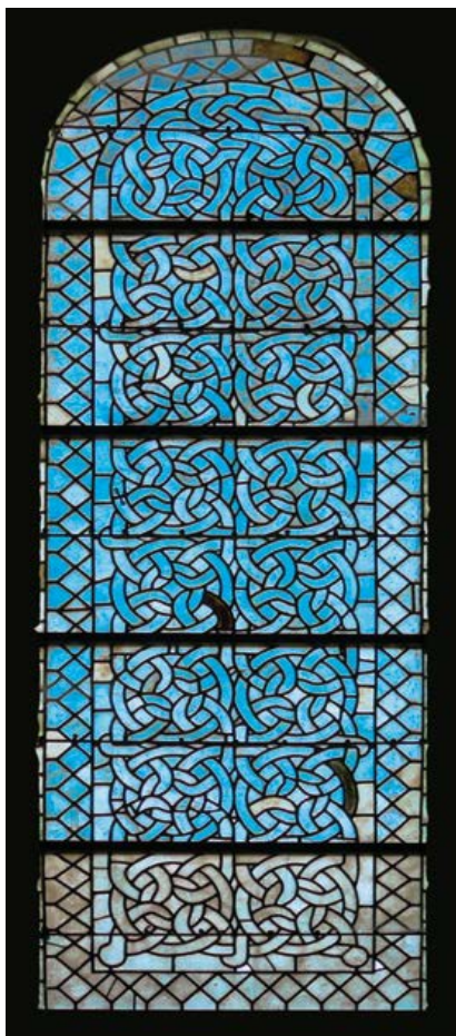
Glasraam uit de abdij van Obazine in de typische sobere cisterciënzerstijl. De abdij is gesticht in 1127 en werd opgenomen in de orde van Cîteaux in 1147.

De hierboven besproken teksten zijn kleinere werken. Stephanus' naam is echter vooral verbonden aan de twee geschriften die gelden als de grondvesten van de cisterciënzerorde: het Exordium parvum ('kleine ontstaansgeschiedenis') en de Carta caritatis ('liefdescharter'). Over het precieze aandeel dat Stephanus in beide