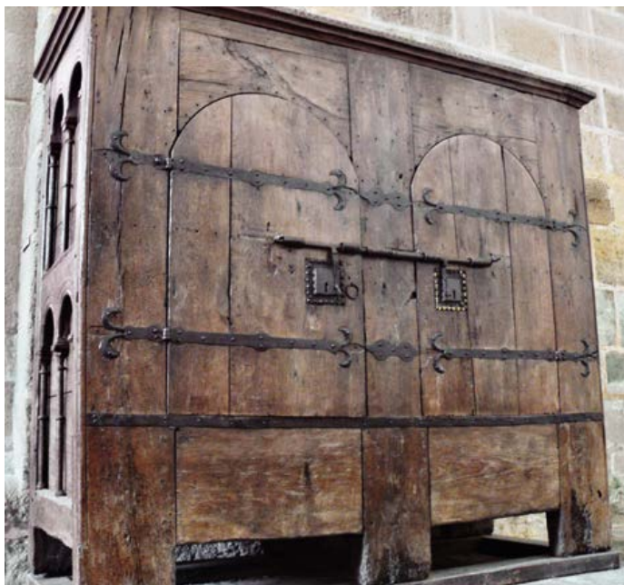
Kast voor de bewaring van de liturgische boeken in de abdij van Obazine (12de eeuw).

Beide samen, liefde voor de Regel en het gebed voor de voorgangers, verlenen de kracht om de stichters in hun leefwijze na te volgen en net als zij de pijn en de moeite van de Regel te dragen. Stephanus verheelt niet dat de weg allesbehalve aantrekkelijk oogt. Hij is moeizaam en nauw, en doet in niets onder voor het gewicht van de dag en de hitte die de stichters hebben moeten verduren. Het voorbeeld van de stichters helpt op het moment dat de liefde onder de inspanning begint te tanen. Het gebed slaat de brug voor wie later komen en steun behoeven, zodat ze niet opgeven maar doorzetten. Want alleen wie volhoudt, zal uiteindelijk de rust mogen kennen.