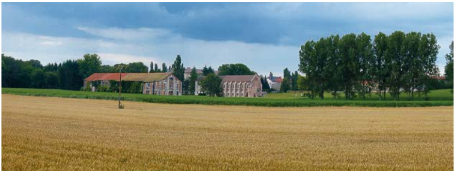
Panorama abdij van Cîteaux.

In het najaar van 1099 ontving Albericus de abtsstaf, die Robertus had achtergelaten, uit de handen van bisschop Walter van Chalon. Een van zijn eerste wapenfeiten was de verplaatsing van het primitieve kloostertje. De voornaamste reden schijnt het gebrek aan water te zijn geweest. De Coindronbeek en de ‘waterput van Robertus’ volstonden niet voor de huishouding van een ordentelijk klooster met keuken, molen, was- en eetplaats, ateliers, latrines, enzovoort. La Fourgeotte werd verlaten. Twee kilometer zuidelijker bouwden Albericus en zijn broeders het Nieuwklooster dat zich op de plaats van de huidige abdij van Cîteaux bevond. Een kleine kerk in steen werd er op 16 november 1106 ingewijd en zou er tot 1791 blijven staan – in de Franse