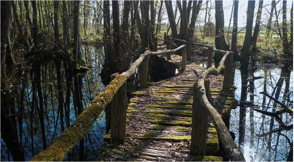
Het woud van Bourgondië (dal van Cent-Fonts).

niet echt 'bourgondisch' kon genoemd worden, kende het toch al meer afwisseling, zeker toen de wijn zijn intrede deed, volgens sommigen vanaf de zesde, volgens anderen vanaf de tweede eeuw v.Chr. De eerste wijnstokken werden op de zuidelijke hellingen van de valleien van de Rhône en de Saône geplant: bescheiden voorlopers van de grands crus de Bourgogne . Het woud verschaftte ook bouw materiaal, gereedschappen en energie voor de ertsontginning en de metaalnijverheid.