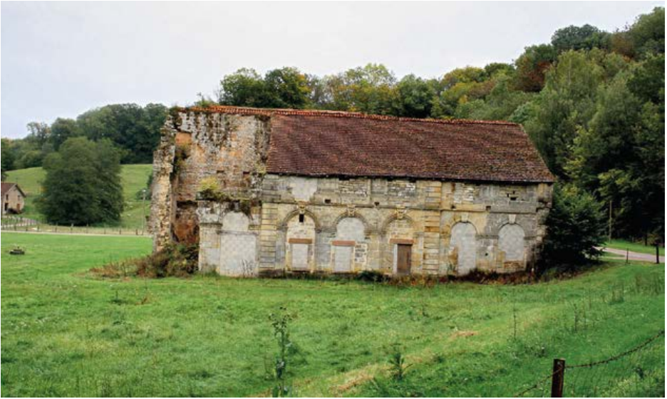
Ruïnes van de cisterciënzerabdij van Morimond (gesticht in 1115).