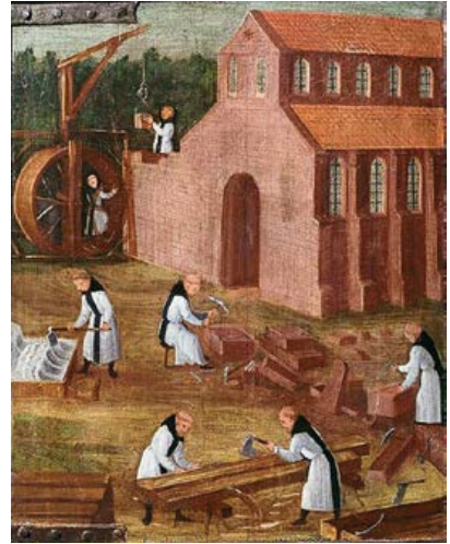
“Ze zijn monniken als zij van het werk hunner handen leven.” (RB 48,8) Scènes uit het leven der cisterciënzers , prent van Jörg Breu de Oudere, Stiftskirche Zwettl, ca. 1500. Cisterciënzermonniken bij de bouw van een kerk , paneel van het stichtingsbord van Maulbronn, ca. 1450.