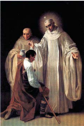
Francisco Goya, Stephanus Harding ontvangt Bernardus van Fontaine , olie op doek, 1787, Valladolid, Spanje.

Toen dan de zalige vader Stephanus het hem toevertrouwde ambt volgens de ware regel van de nederigheid van onze Heer Jezus Christus moedig had vervuld, was hij aan het einde van zijn krachten door een slepende ouderdomskwaal die zijn ogen verduisterde zodat hij niet meer kon zien. Daarom legde hij zijn herderlijke zorg neer en verlangde vrij te zijn voor God alleen ( solī Domino vacaret ) en voor zichzelf door het smaken van de heilige beschouwing. 14