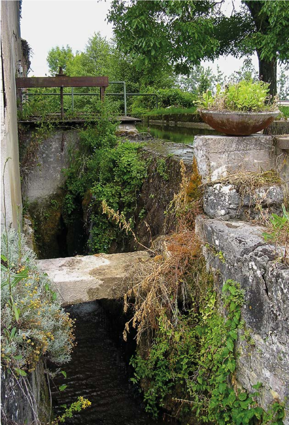
Het allodium van Cîteaux en 'La Cent-Fonts' (Sansfond), het kleine riviertje dat zich in de Vouge werpt ter hoogte van de abdij van Cîteaux. Aanvankelijk reikte de Sansfond niet tot aan het Nieuwklooster, maar de 'witte monniken' verlegden de loop van het riviertje tot aan hun klooster.