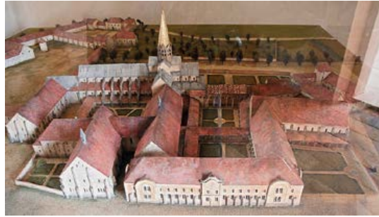
Maquette van het klooster van Cîteaux.

Terug in Bourgondië traden beide pelgrims toe tot de hervormde abdij van Molesme, wellicht in 1085. Stephanus werkte zich op tot secretaris van abt Robertus. Zowel Petrus als Stephanus maakten deel uit van de stichtersgroep van Cîteaux, maar Petrus keerde na ruim een jaar met Robertus naar Molesme terug. Van dat ogenblik af besloten