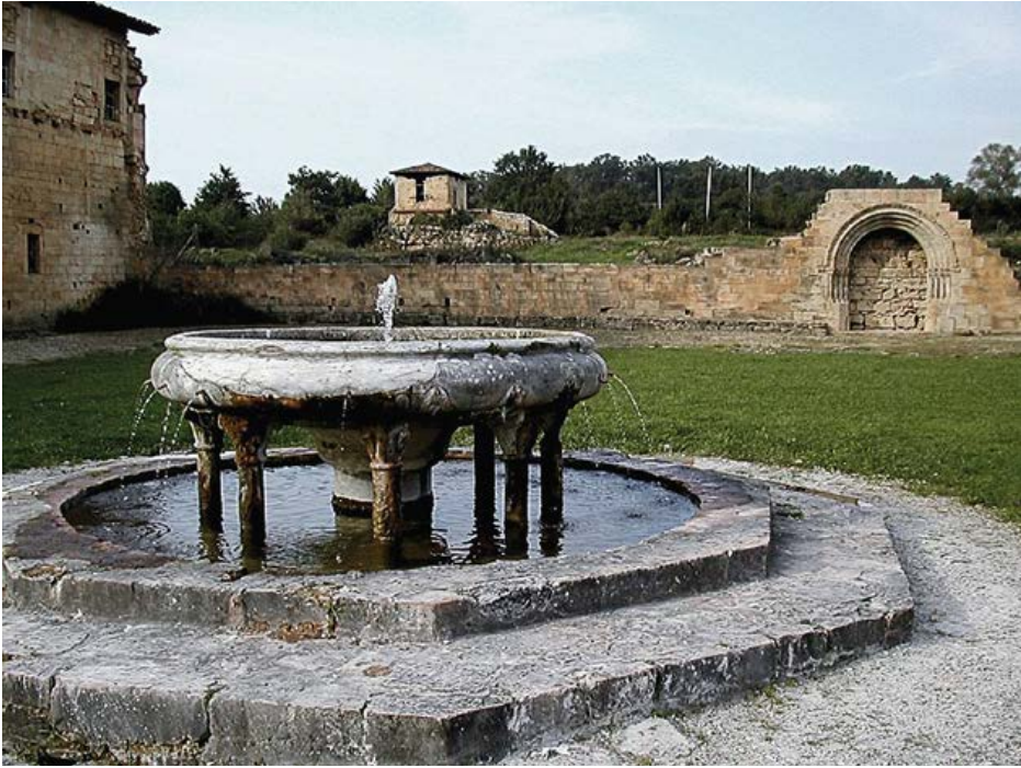
Resten van Bonnefont in de Franse Pyreneeën, de dochter van de cisterciënzerabdij van Morimond.

dagorde binnen het kloosterslot te volgen. De conversen zullen in de twaalfde en de dertiende eeuw een grote bijdrage leveren aan de expansie van de cisterciënzers in Europa.