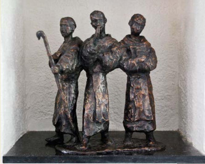
De drie stichters van Cîteaux, bronssculptuur van Joke Sterk.

in Efrata en vonden haar op een open plek in het woud '. De psalmist heeft het over de ark van het verbond, Gods zichtbare aanwezigheid onder het volk. Het bescheiden kloostertje dat de eerste cisterciënzers op die open plek in het woud van Cîteaux met takken en leem optrokken, zou hun 'verbondsark' worden. Daar zouden zij Gods tegenwoordigheid onophoudelijk zoeken en smaken.