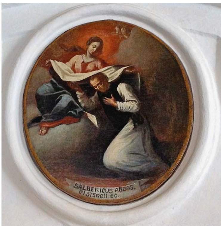
Albericus van Cîteaux ontvangt de witte kovel van de H. Maagd. Fresco in Rein Abbey (Australië).