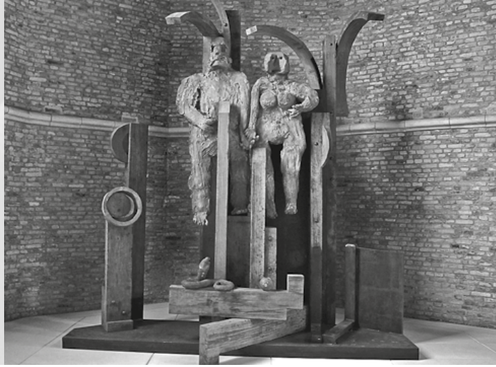
Anthony Caro, Jardin Paradis , église St. Jean-Baptiste, Bourbourg.