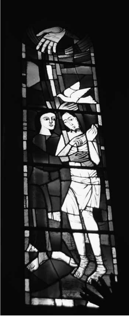
Doop van Jezus in de Jordaan , glasraam in de Onze-lieve-Vrouwekerk van Maastricht. De glaskunstenaar beeldde Gods Geest zowel met een duif als met de hand uit den hoge uit.

van Marcus 3,1-6: daar speelt de scène zich af in de synagoge, hier in de tempel. Daar zijn het net als hier farizeeën die de tegenspelers van Jezus zijn. Daar wordt er net als hier iemand in het midden van de gemeenschap geplaatst. En in beide gevallen wordt Jezus op de proef gesteld om hem vervolgens te kunnen aanklagen en uit de weg te kunnen ruimen: bij Marcus willen de farizeeën weten of Jezus het sabbatsgebod overtreedt, hier willen farizeeën en schriftgeleerden weten of Jezus de Tora van Mozes met betrekking tot overspel naast zich neerlegt.