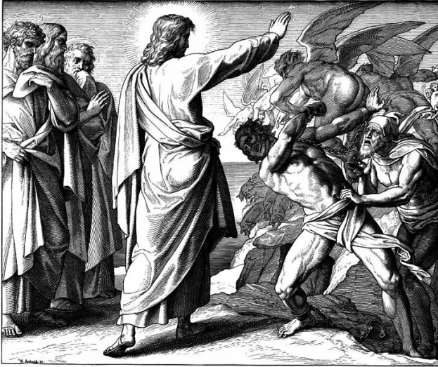
Jezus drijft demonen uit, prent van Julius Schnorr von Carolsfeld (1794-1872) in Die Bibel in Bildern (1853).

van God werkelijk onder de mensen gekomen. De strijd tegen Beëlzebul krijgt een diepteperspectief doordat het geplaatst kan worden tegen de achtergrond van dé strijd van god tegen de onderdrukker bij uitstek: de farao van Egypte.