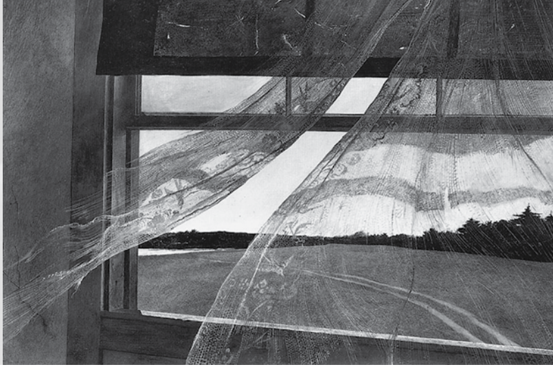
Andrew Wyeth, Wind from the sea , tempera, 19 x 28, 1948. Museum of Modern Art, New York.