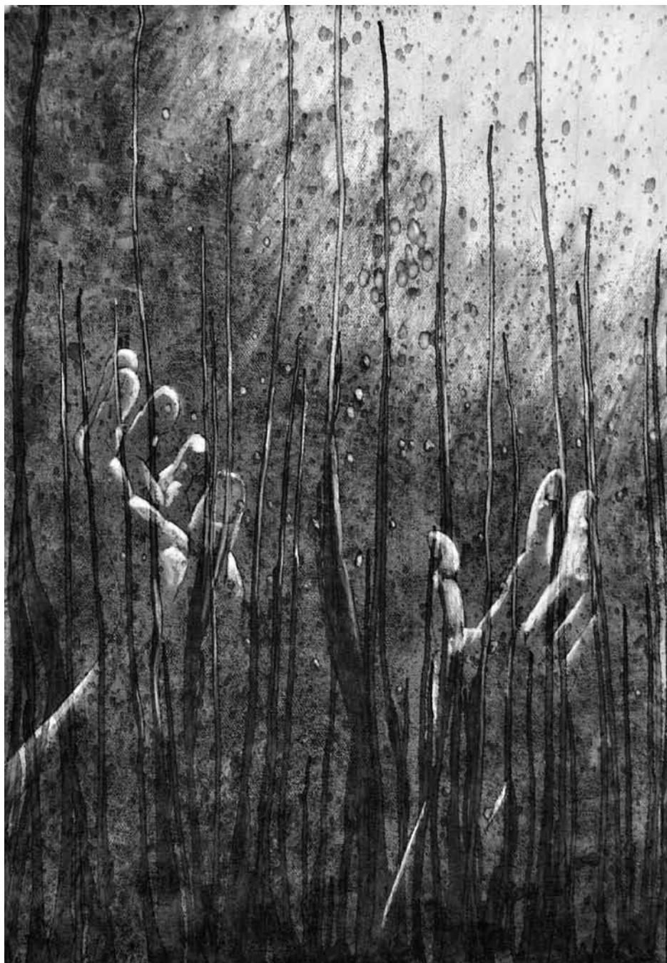
Johan Graafland, De kunst van het loslaten is de kunst van het vastgrijpen , tekening. De tekening drukt door de donkere tinten en de verstikkende stekels de rauwheid van het leven uit. Tegelijkertijd dringt het verlossende licht door waar de mens zich naar mag uitstrekken. De mens die kan loslaten, wordt door het Licht gegrepen.